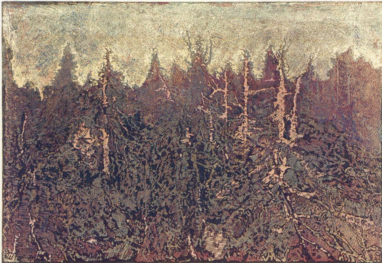
Josef Váchal, Mrtvý les