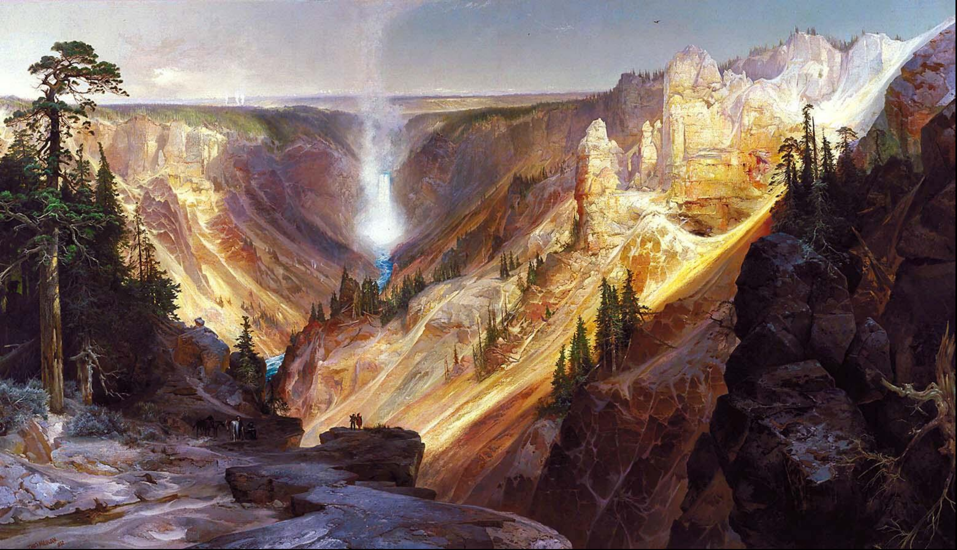
Thomas Moran, Velký kaňon (později Yellowstone národní park), 1871